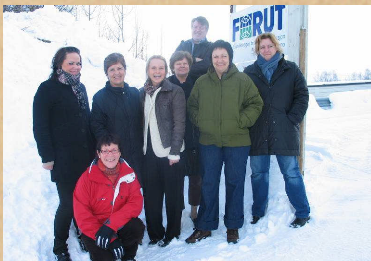
Et utvalg ansatte i februar 2009

Det legges vekt på god intern informasjonsflyt gjennom ukentlige kontormøter der alle ansatte blir informert om det løpende arbeidet i alle avdelinger. En gang i måneden er det utvidet møte med intern kompetansedeling.