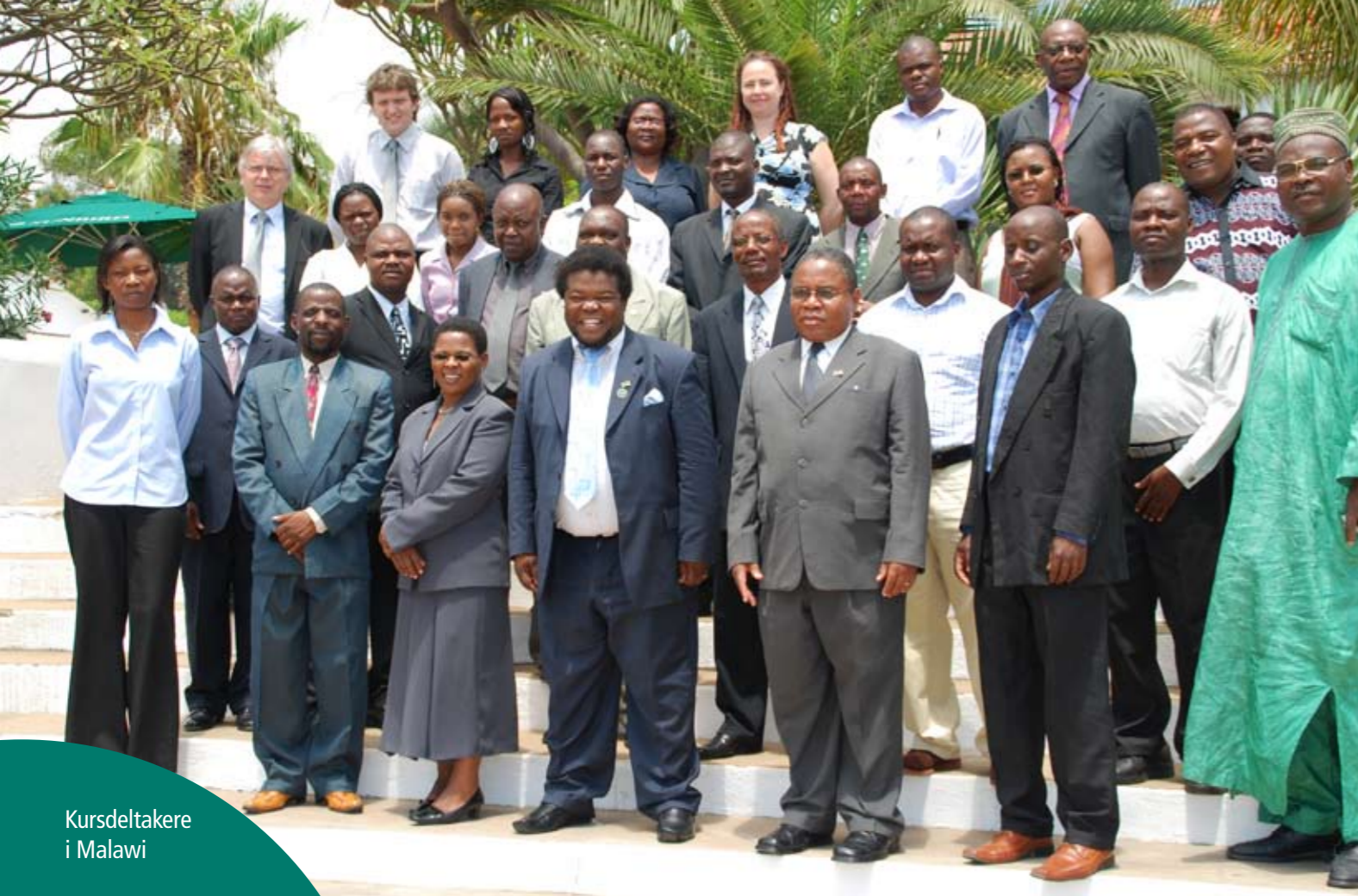
Kursdeltakere i Malawi