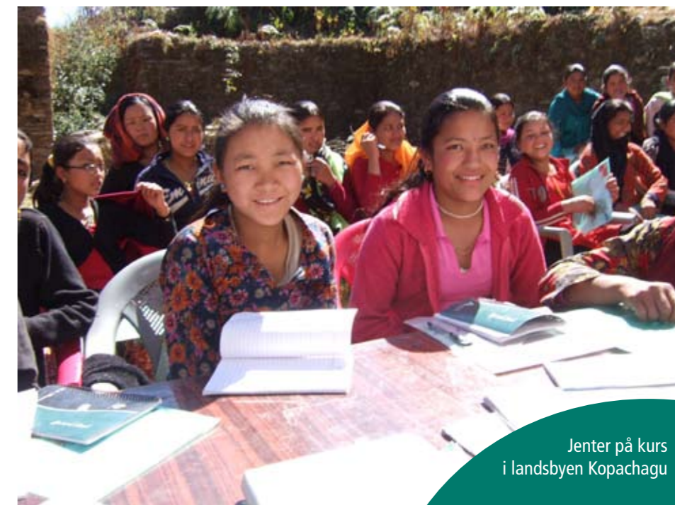
Jenter på kurs i landsbyen Kopachagu

Det var stor aktivitet under seminaret. Jentene deltok ivrig i gruppearbeidet, og det ble gitt fylldige presentasjoner som ble gjenstand for felles refleksjon og spørsmål.