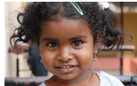
13 Ny barneaksjon.