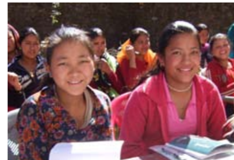
4 Styrking av jenters selvtillitt.