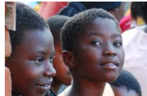
9 Malawiske speiderjenter.